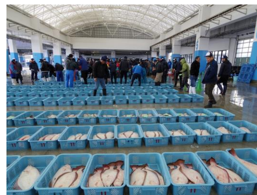
試験操業の水揚げの様子（相馬）